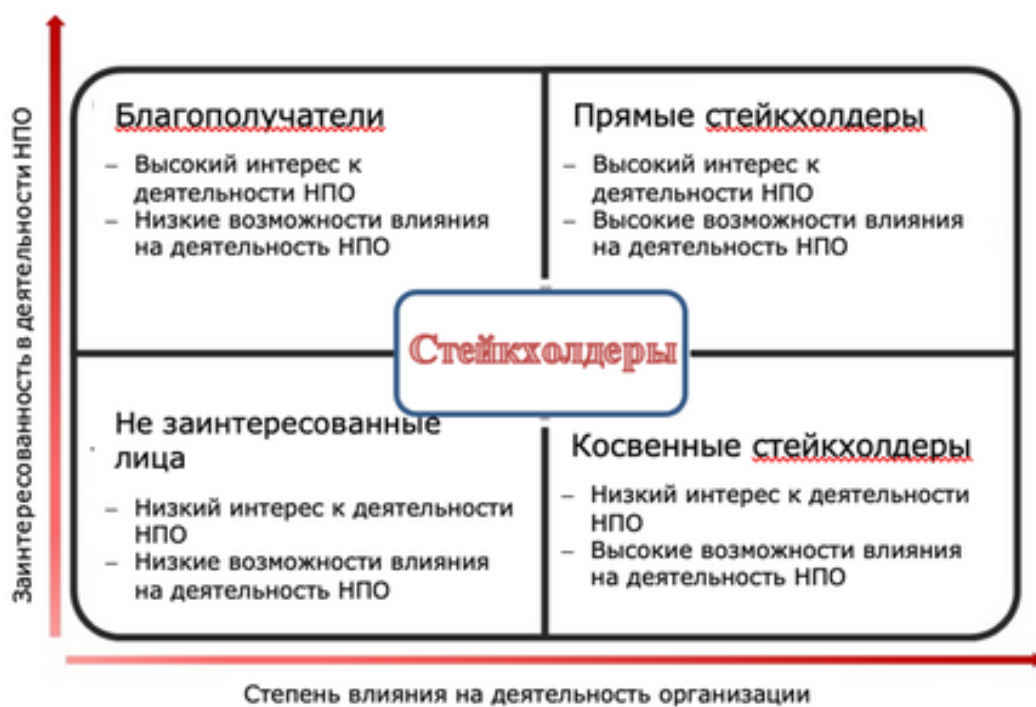
Matricea de distribuție a părților interesate ale ONG-urilor